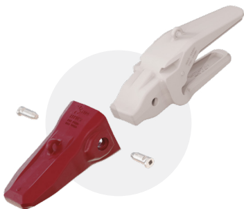
TWINMET 1 для экскаваторов 250 - 400 т

Двухсоставная система зуб-адаптер специально разработана для небольших карьерных экскаваторов с пластинчатой режущей кромкой толщиной 140 мм.