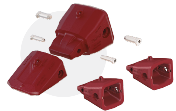
TWINMET Retrofit para las primeras experiencias con TWINMET

El sistema original de 3 partes en los tamaños 5 y 7 se creó para los labios fundidos TERRA y proporciona la máxima productividad y fiabilidad en terrenos muy abrasivos con impactos fuertes.