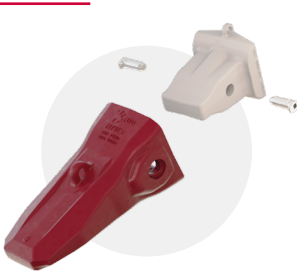
TWINMET 1 para excavadoras de 250 – 400 t

El sistema de dientes de 2 partes está especialmente diseñado para los labios fundidos TERRA más pequeños de 116" y 136" que operan en terrenos con un nivel bajo o medio de abrasión e impacto.